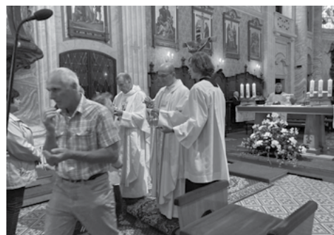
Pouť ve Štípě