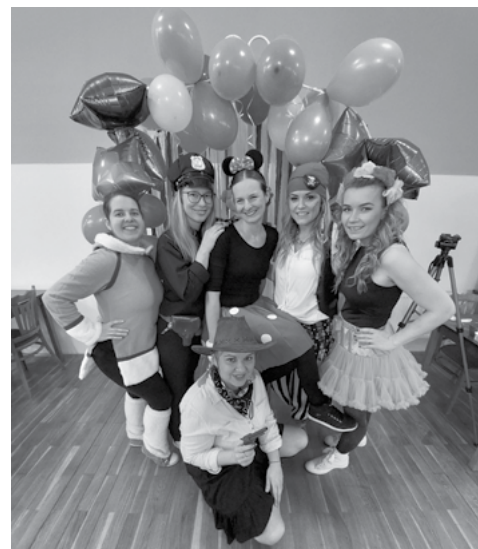
Šikovné maminky – pořadatelky