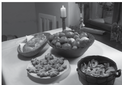
Vánoce v muzeu