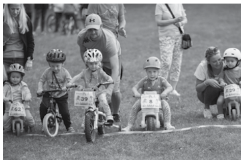
Startují ti nejmenší