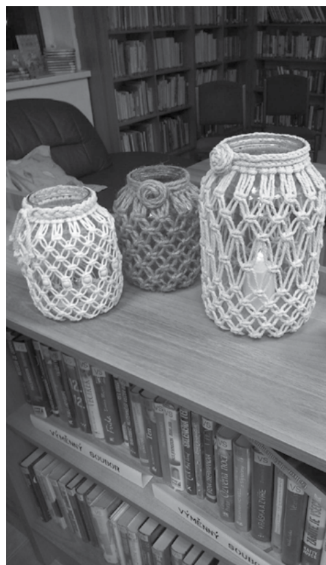
Výsledky našeho snažení