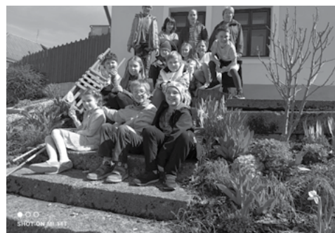
Velikonoční pozdrav od muzea