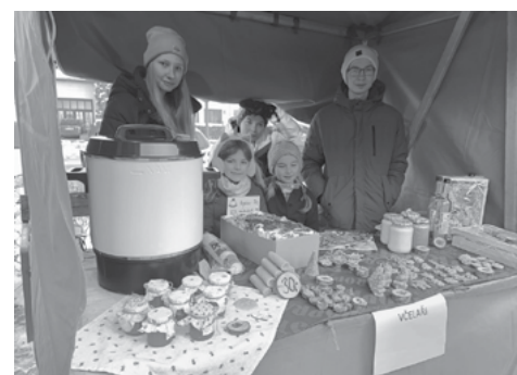
Loňský vánoční jarmark

Děkujeme všem, kteří nás na vánočním jarmarku podpořili.