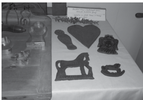
Z výstavy Historie perníku