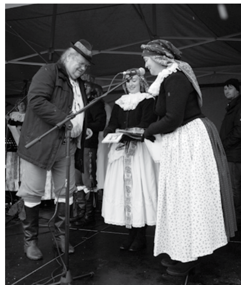
Křest vánočního CD