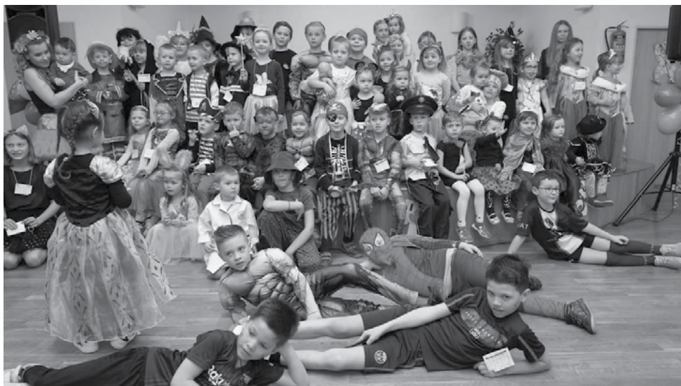
Děti jako smetí