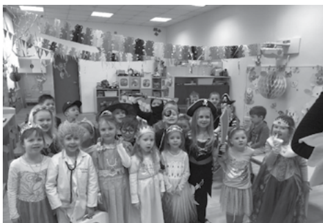
Jsmem malí, ale šikovní