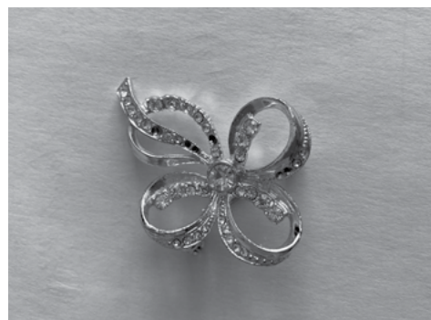
Stříbrný čtyřlístek Za dobrý počín a vytrvalost