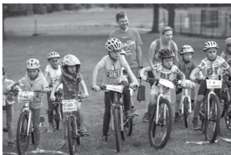
Připravit ke startu...