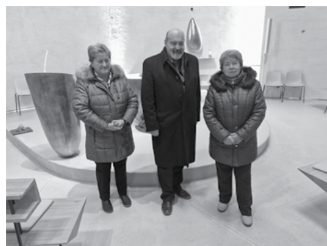
Návštěva profesora Tomáše Halíka