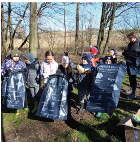
Odpad z přírody sám nezmizí