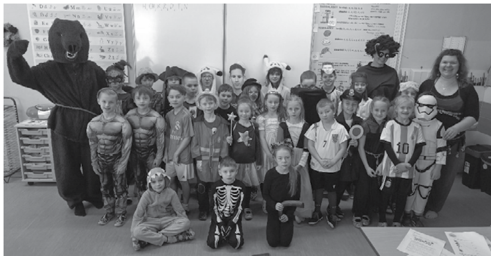
Medvěd u školáků