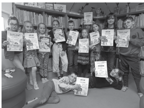
My všichni máme rádi básničky