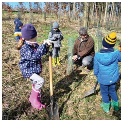
Zasad' si svůj strom