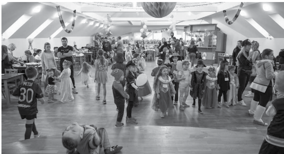
Pořád se něco dělo