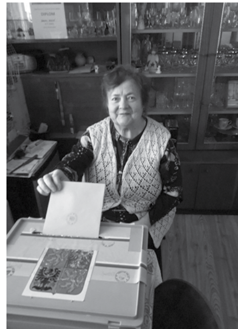
Volilo se i z domova