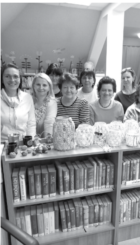
Drhání nás bavilo