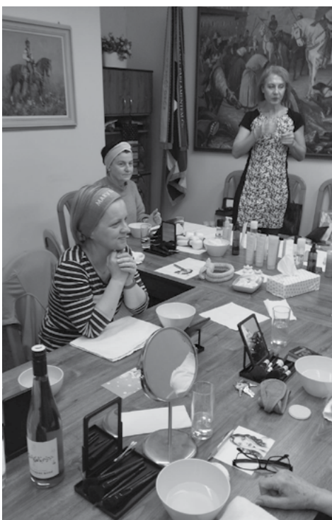
Natřeme to všem misskám