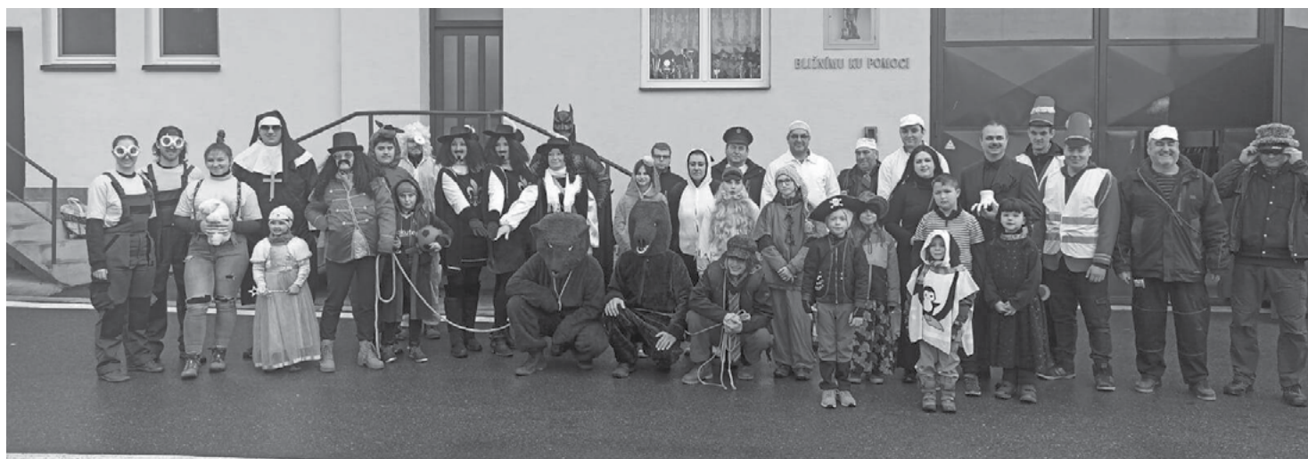
Vodění medvěda 2023