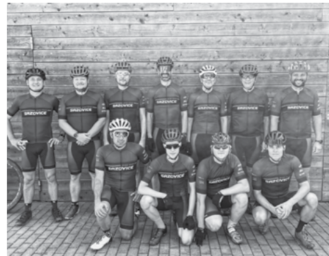
Členové Bike Teamu Sazovice