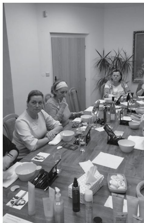
Všechny chceme být hezčí a mladší