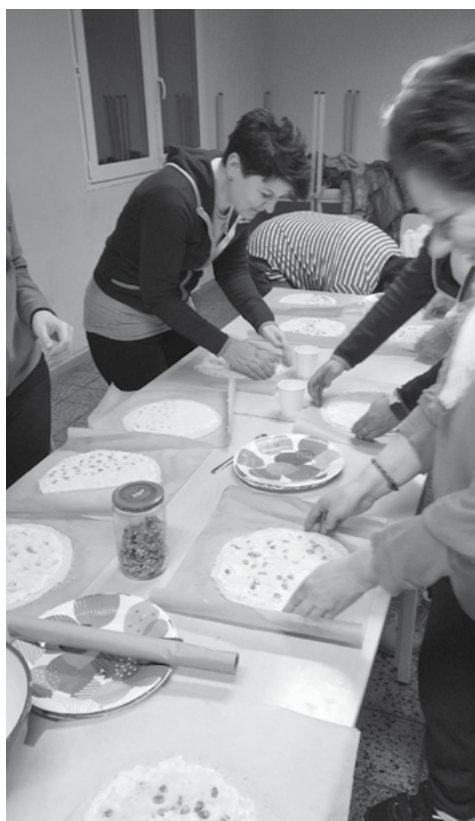
Sladké mámení po valašsku