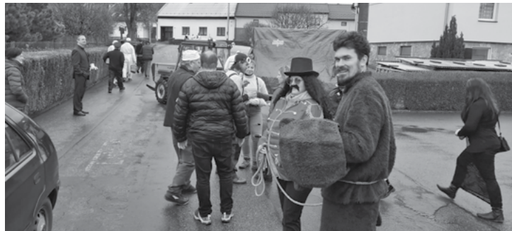
Co se to vyklubalo z medvěda!