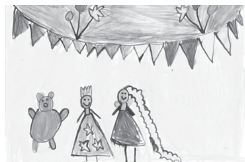
Takhle jsme si medvěda namalovali