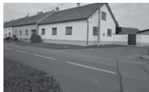
Kučerův dům č. 93 na Padělkách