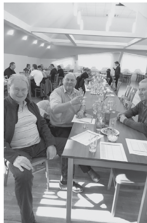
Která je nejlepší?