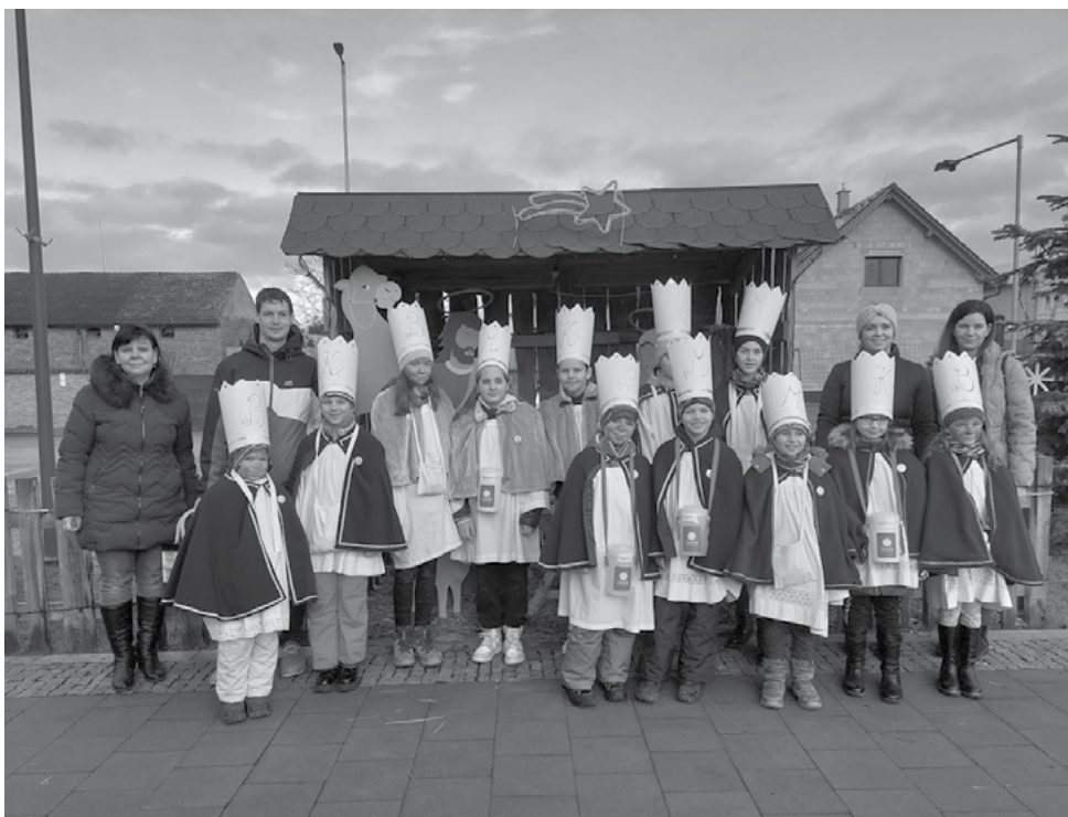
Než jsme vyšli na koledu

Ve 49 obcích a městech na Zlínsku (včetně Zlína) vynesla sbírka 3 075 555 Kč. V celé Čes- ké republice činil výnos 161 974 398 Kč.