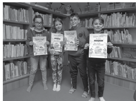
Vítězové recitační soutěže