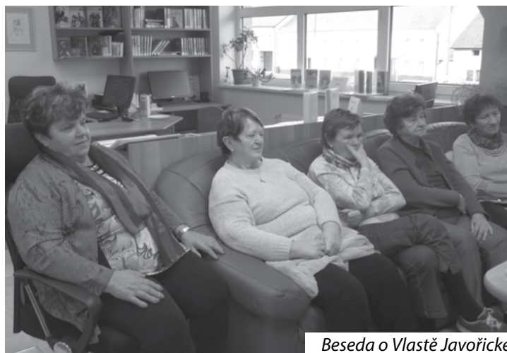
Beseda o Vlastě Javořické