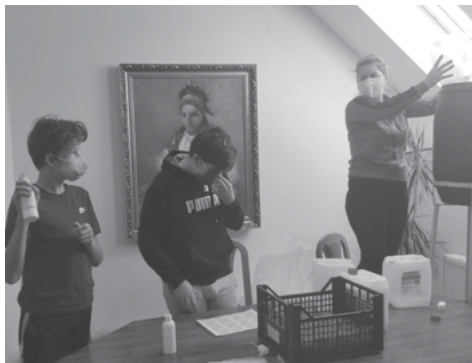
Pomoc školáků při plnění