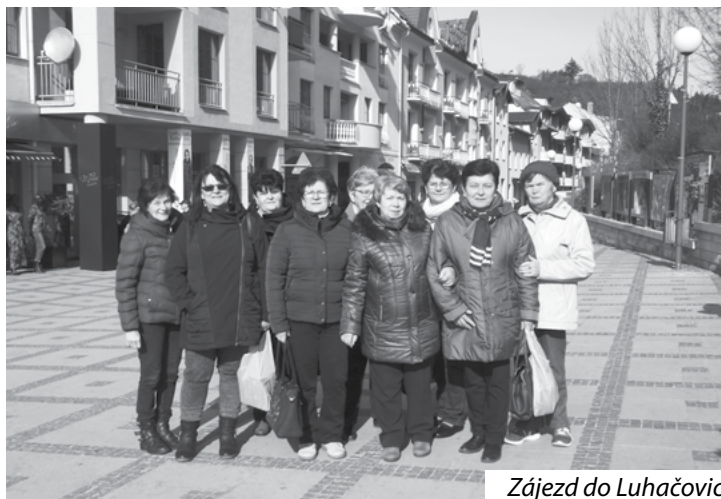
Zájezd do Luhačovic