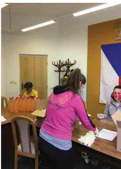
Balení ochranných prostředků