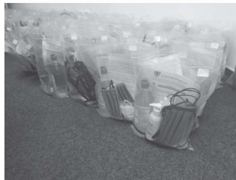
Balíčky pro rodiny