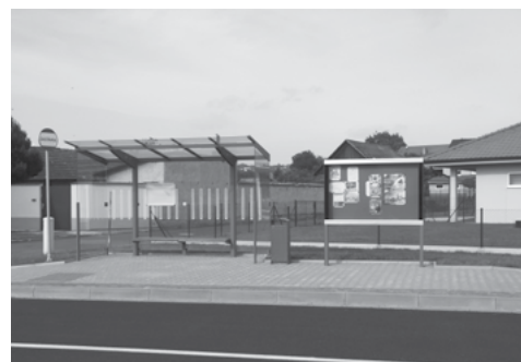
Nová autobusová zastávka na Padělkách