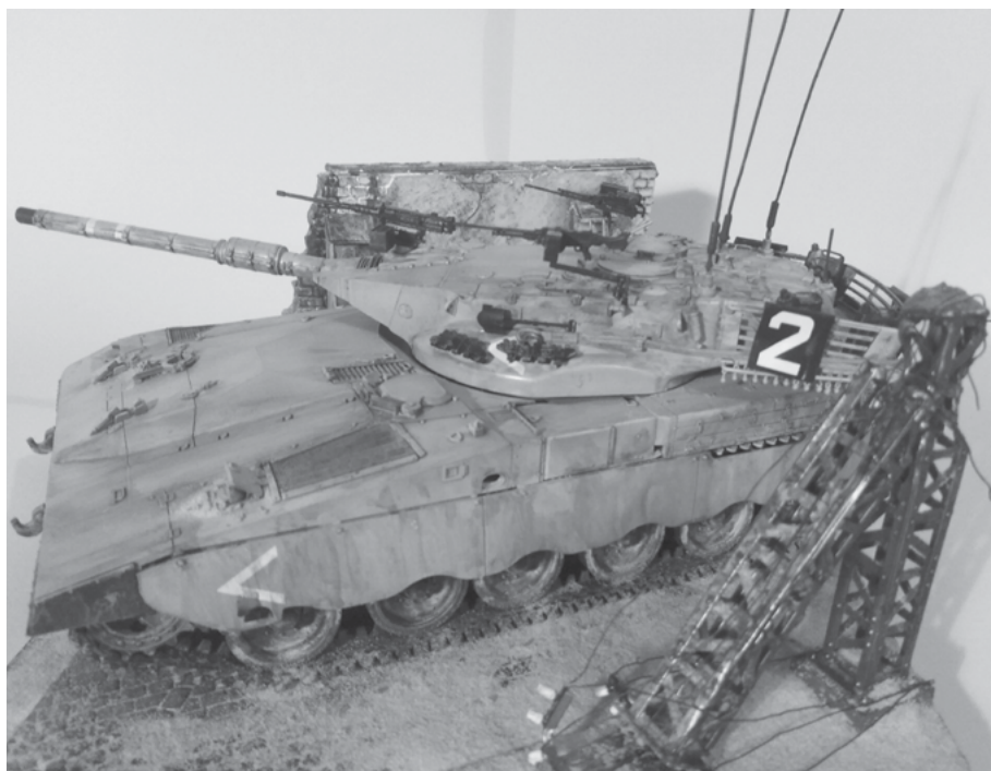
Diorama – tank