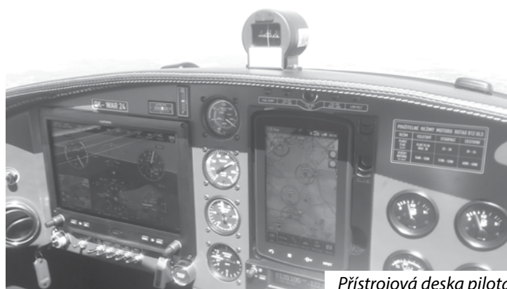
Přístrojová deska pilota