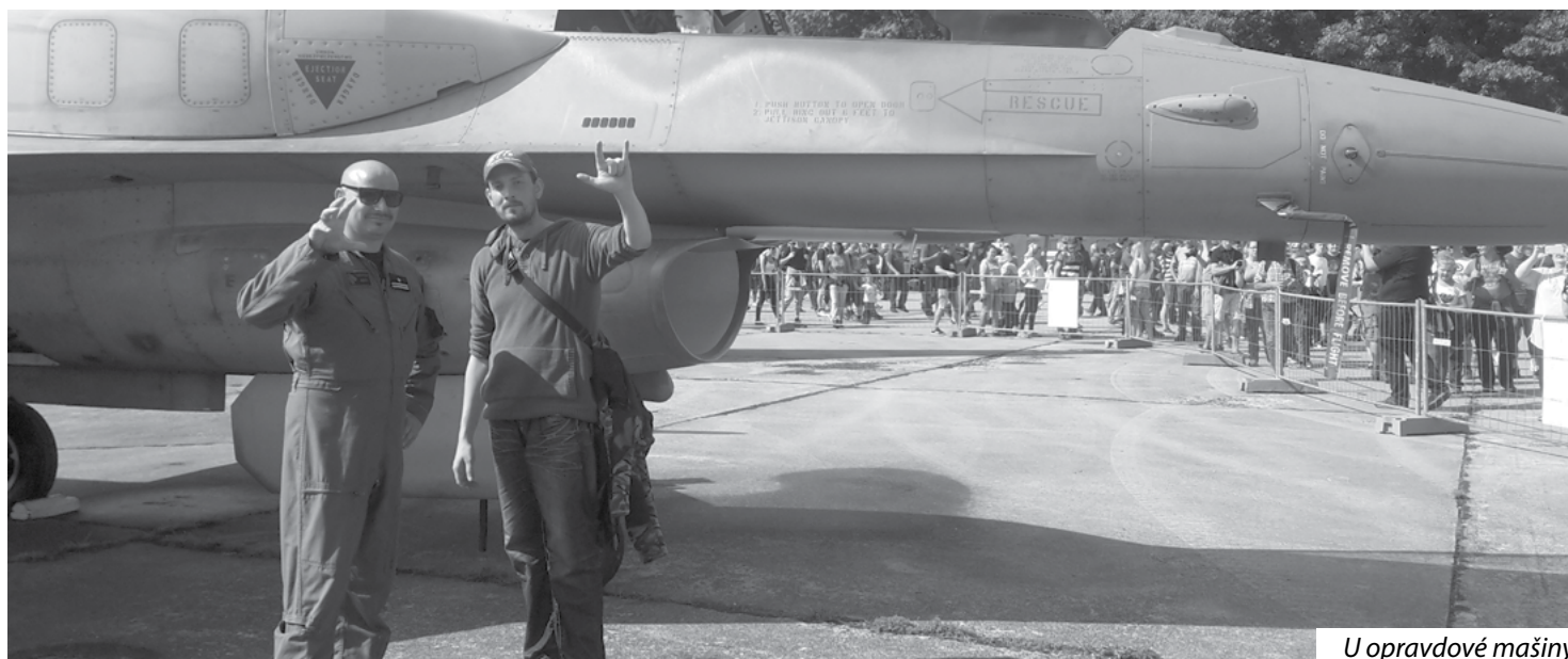
U opravdové mašiny