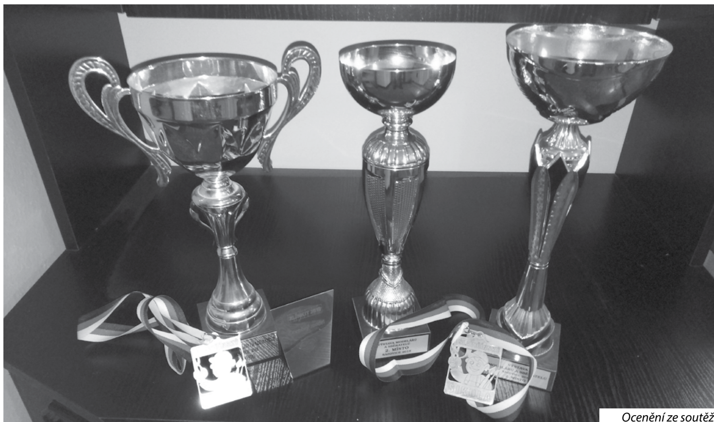
Ocenění ze soutěží