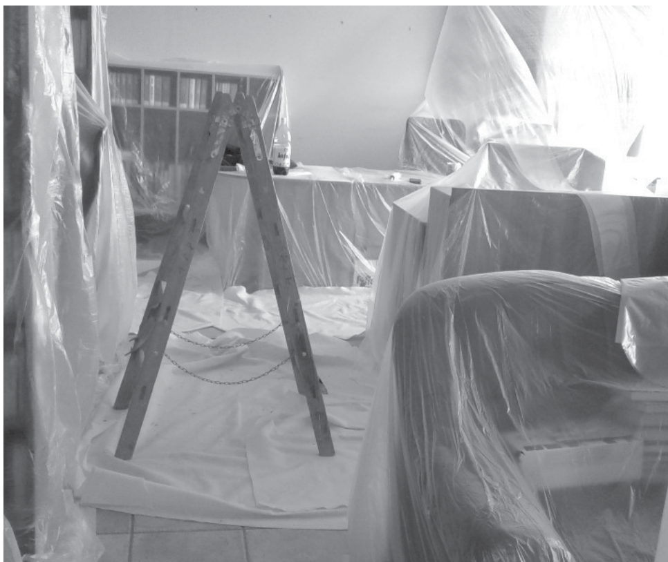
Před výměnou oken – takhle čtenáři knihovnu neznají