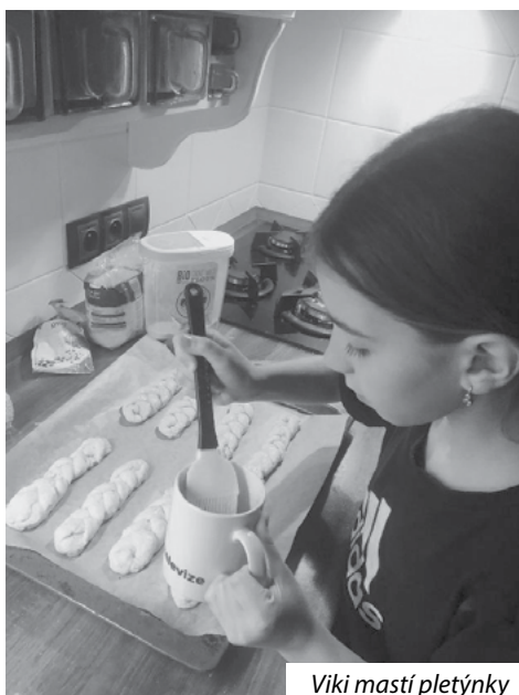
Viki masťí pletýnky