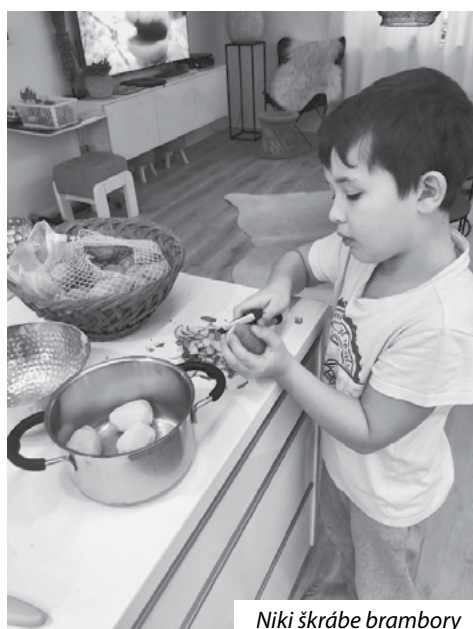
Niki škrábe brambory