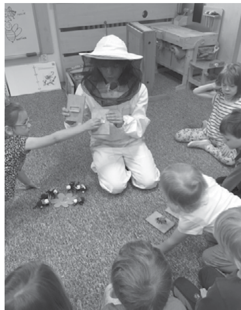
MŠ – Beseda o včelkách