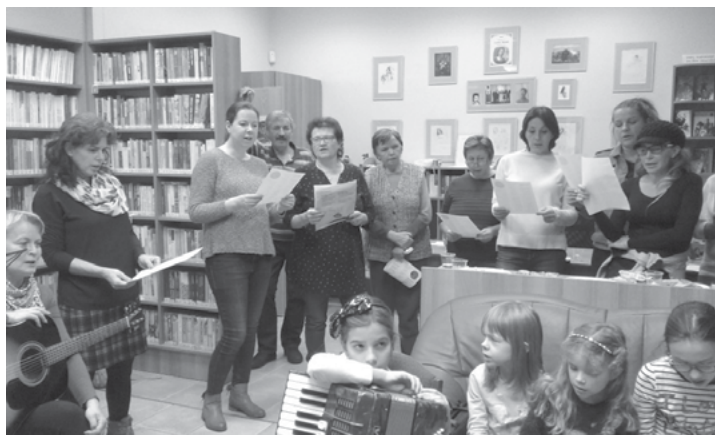
Česko zpívá koledy s Deníkem