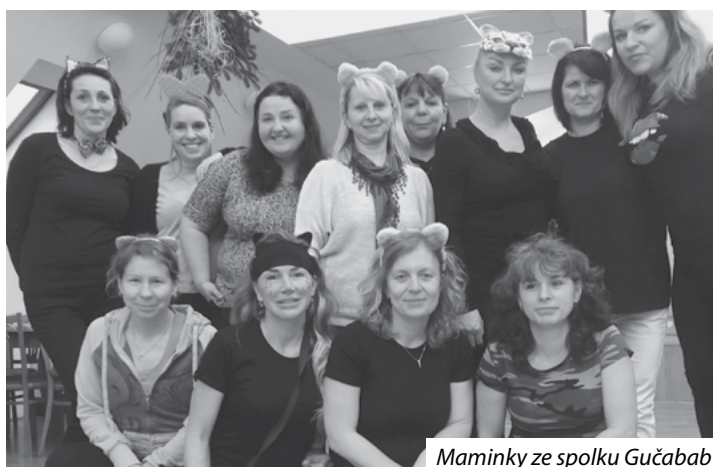
Maminky ze spolku Gučabab