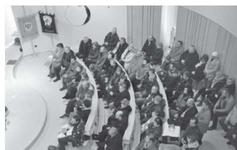
Tolik posluchačů na koncertě ještě nebylo