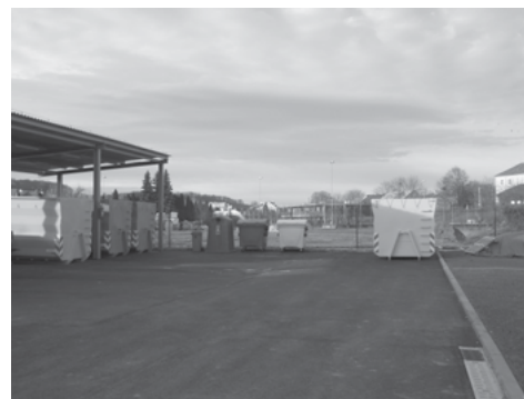
Nový sběrný dvůr