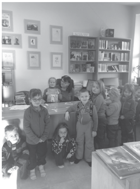
MŠ – beseda v knihovně