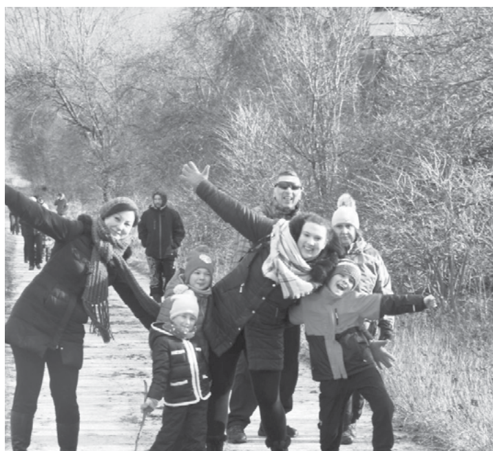
I tak jsme se pěkně vydováděli