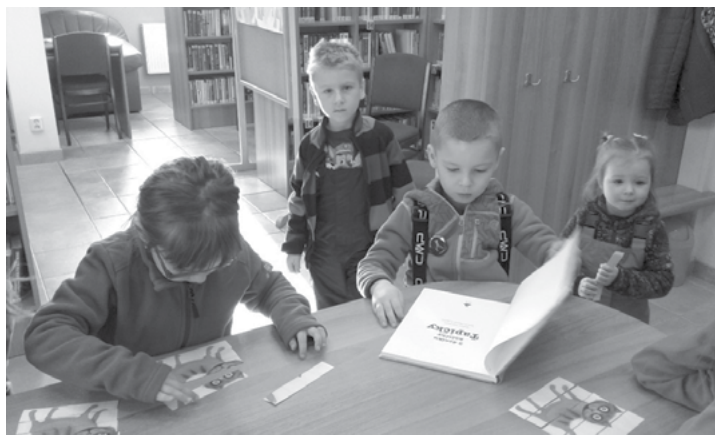
Nejmenší čtenáři z MŠ