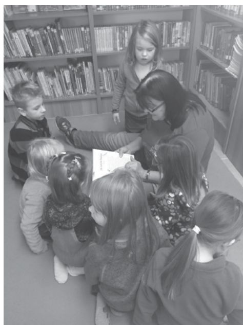
MŠ – beseda v knihovně

Výlet dětí MŠ do Milotic, výlet žáků ZŠ do družební školy Mikulůvka