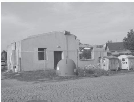
Demolice původního domku na sběrném dvoře

Ať nový sběrný dvůr slouží ke spokojenosti všem občanům obce Sazovice.