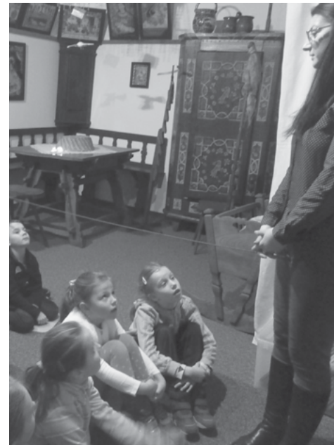
V muzeu Luhačovského Zálesí