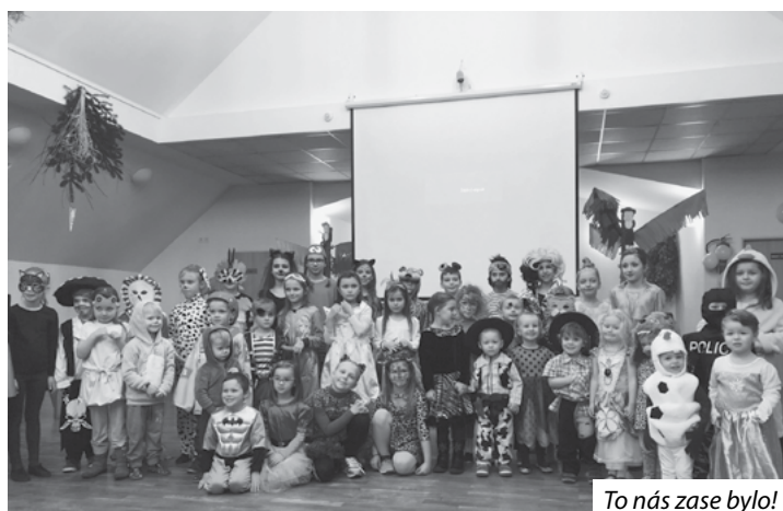
To nás zase bylo!