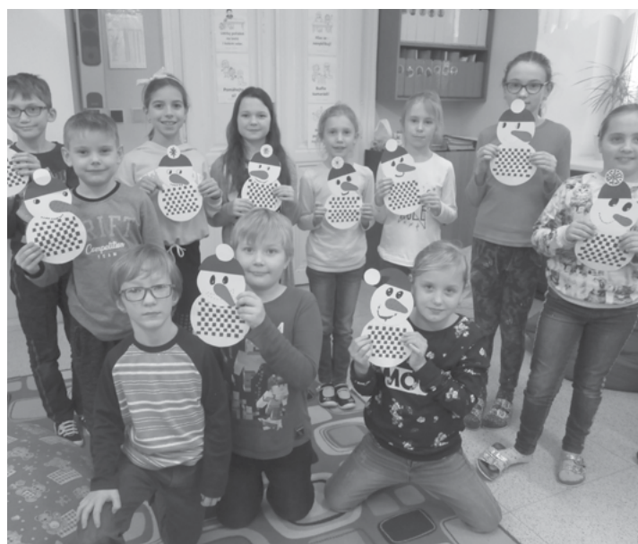
Badatelský kroužek- papírové tkaní

Přírodovědná soutěž – program: Léčivé byliny