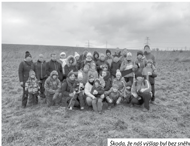
Škoda, že náš výšlap byl bez sněhu