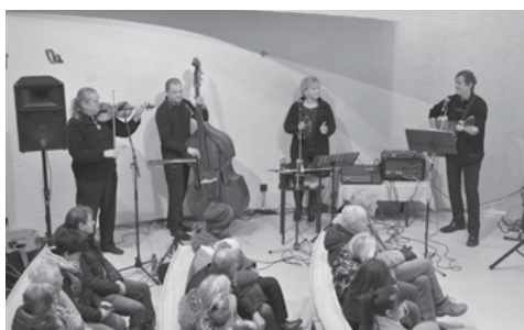
Kapela Hostband je známá a oblíbená