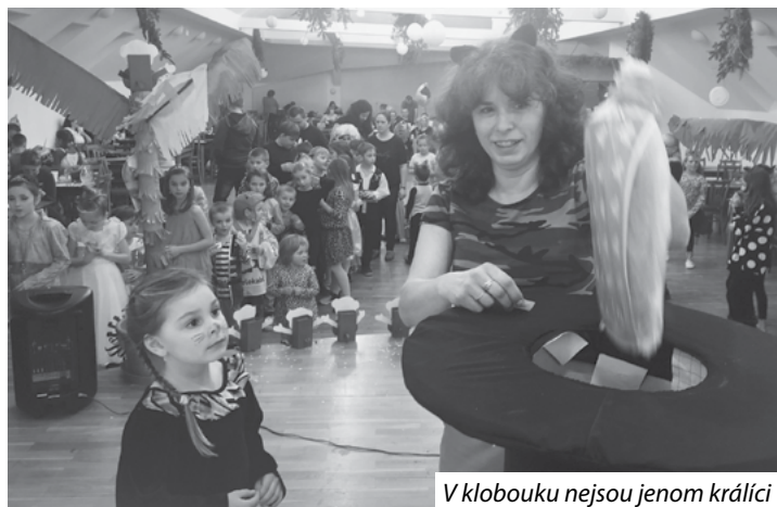
V klobouku nejsou jenom králci