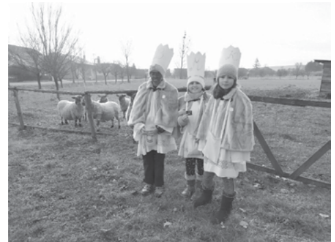
Dívčí tříkrálový tým