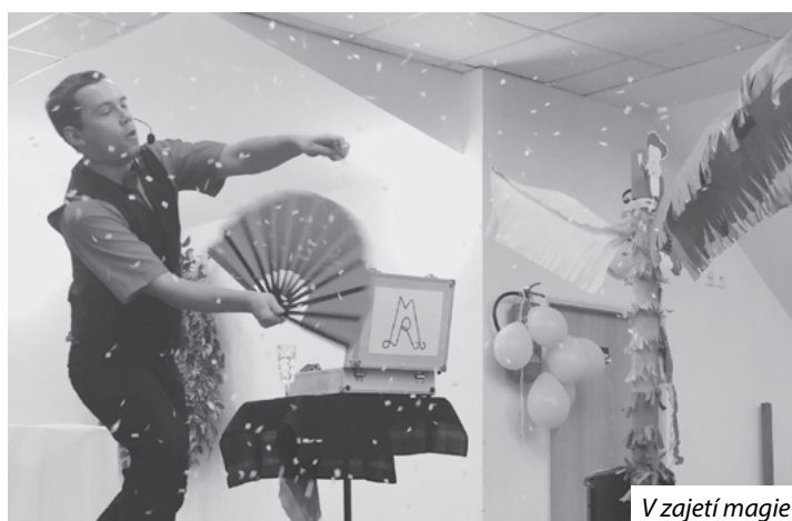
V zajetí magie