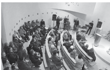
Všechna místa obsazena