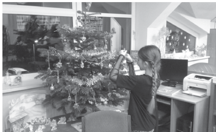
Zdobení stromečku a perníčků v knihovně