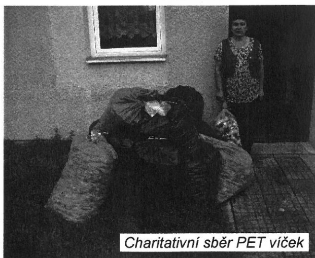
Charitativní sběr PET víček