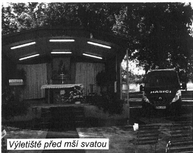
Výletišťe před mší svatou