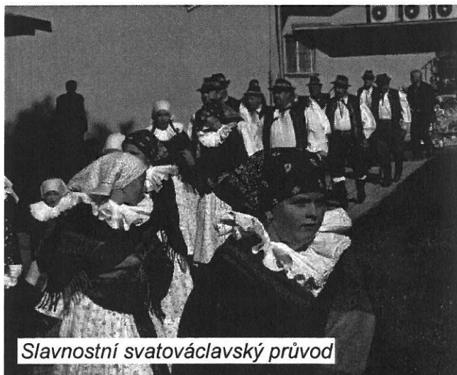
Slavnostní svatováclavský průvod