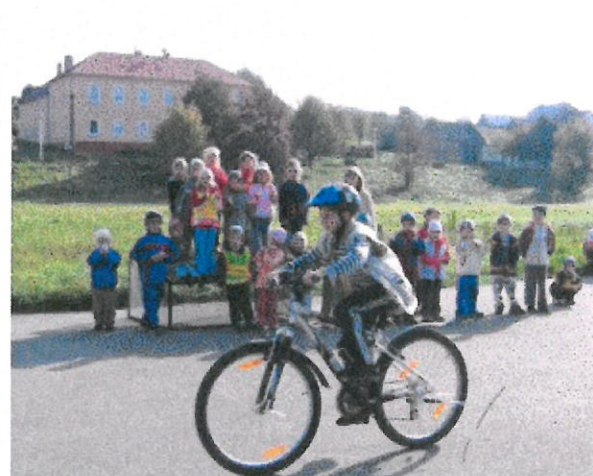
Dopravní akce na hřišti sportovního areálu před školou byla nejen zábavná, ale také poučná