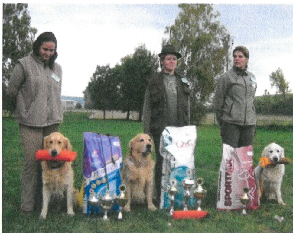
Vítěze čekala chutná odměna

Všem kteří se na této akci nějakým způsobem podíleli bych chtěl ještě jednou poděkovat jménem svým i jménem Retriever Klubu CZ.