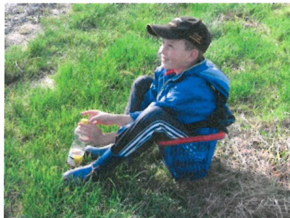
Podzimní vycházka do lesa je pro děti každoročně příjemným zážitkem