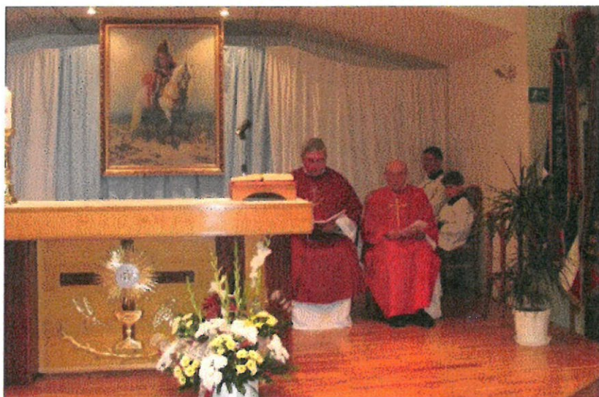
Mše svatá proběhla v prostorách společenského sálu OÚ Sazovice