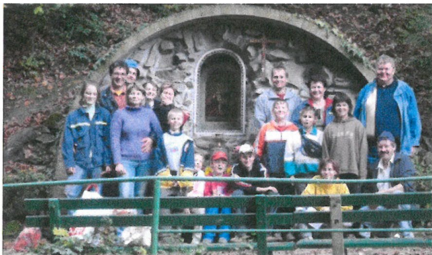
Vycházka do přírody 6. 10. 2007