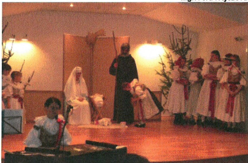
Tak jako v loňském roce, také letos připravujeme vánoční pořad "Půjdeme spolu do Betléma"