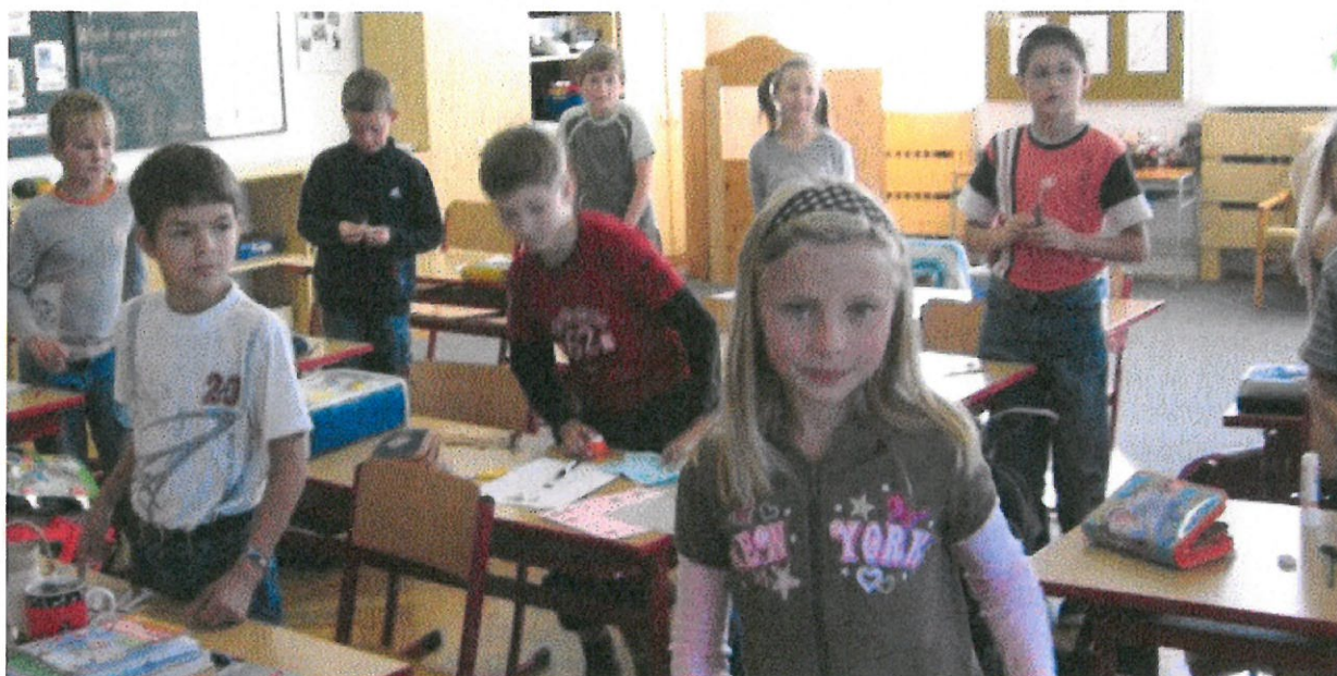
Děti vítají paní poslankyni Šojdrovou, která v září navštívila naši školu